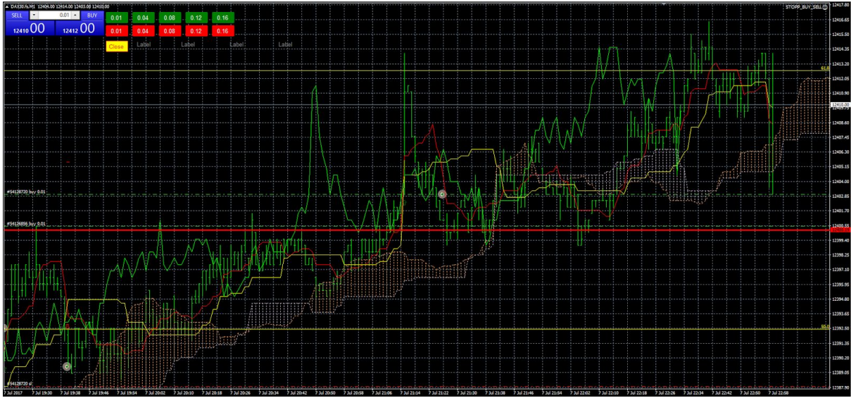
Chart vom Freitag 7.7.17.